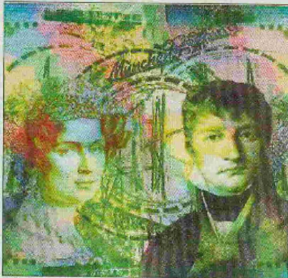
„Der Beginn einer großen Leidenschaft“